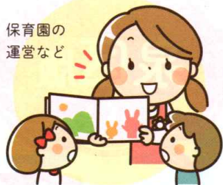
保育園の運営など

また、地域の福祉課題への対応も含め、専門的な知識、技術を地域に還元することも大きな役割となっており、地域に根差した福祉サービスの実践を絶やすことなくつづけています。