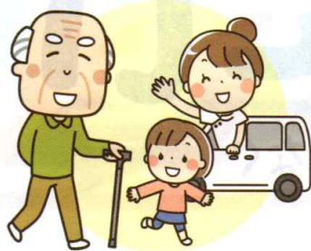
デイサービスセンターの利用など

としては、保育所や児童養護施設の運営、障害者の生活訓練や自立に向けたリハビリの提供、デイサービスや生活介護など、児童、障害、高齢者等の相談に応じ訪問や通所、入所による福祉サービスを行っています。