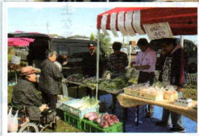
▲「カニツ子」の名は、四郎丸にある落合観音堂にまつわるカニの伝説に由来するものです。