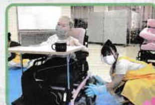
▲ ボランティアさんが車いすをピカピカに!

患者さんたちは「車いすをきれいにしていただけで嬉しかった」「学生ボランティアさんのレクリエーション、クイズが楽しかった。また来てほしい」と話しており、活動を楽しみにしていました。