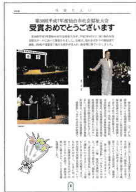
平成7年(第30回)社会福祉大会 社協だより(平成7年11月発行)より

記念すべき第1回は、昭和41年9月に仙台市公会堂(現 仙台市民会館)において開催されました。当時は、仙台市長や各福祉団体の代表者から社会福祉功労者への表彰、各福祉団体からの体験・意見発表、大会決議の採択といった三部構成で行われていましたが、平成に入ってから、表彰式典と記念講演の二部構成に形を変え、今に至っています。