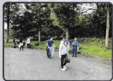
▲ 工場周辺のごみ拾いの様子