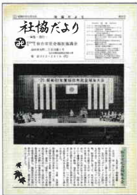
昭和61年(第21回)社会福祉大会 社協だより(昭和61年11月発行)より