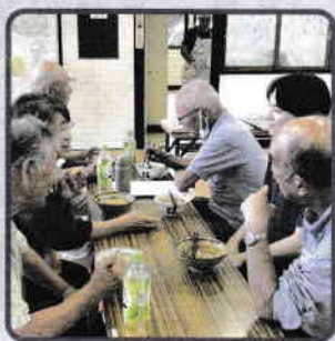
▲ すいとんを食べながら談笑♪

参加者からは「楽しくて時間が足りなかった」「地域外の人たちが来て、このようなプログラムをやってくれるのは嬉しい」などの感想があり、笑顔あふれる交流会になりました。