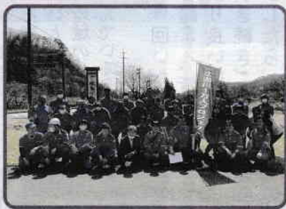
▲ 広瀬川1万人プロジェクトに参加された従業員の皆様

ボランティアに参加した従業員の皆様からは、「清掃を通じて、身近な環境を自分たちで守ることの大切さを実感できました」「沿道でのごみ拾いをしていると、通りかかりの車から『がんばって!』と声をかけていただくことがあり、思わず手を振り返ってしまうほど嬉しいですね」「今後も地域の二員と