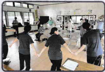
*音楽リエゾンとは、音楽力と社会を“つなぎ”、音楽に関わる方同士を“つなぐ”ことで豊かな音楽文化を創る活動。

第二部は、*音楽リエゾンの講師とともに、「青い山脈」学生時代など懐かしの曲を合唱しました。歌詞に合わせて抑揚をつけたり、身振りをしたり、合いの手を入れたり、音楽の授業を思い出すような楽しいプログラムでした。