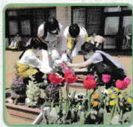
▼ ぽかぽか陽気に花の植え替え作業!

こちらのボランティア活動にご興味のある方は、お気軽に仙台西多賀病院(Tel 245-2111)までお問い合わせください。