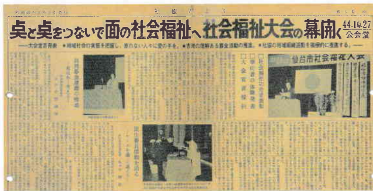
昭和44年(第4回)仙台市社会福祉大会 社協だより(昭和45年1月発行)より