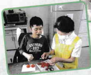
▼ 季節の押し花でハガキと一緒に作ります